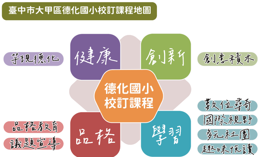
圖一 校本課程發展圖像

本校課程發展委員會依據 12 年國民教育總綱目標、9 項核心素養、學校願景及盤點學校資源後，明確學校課程發展圖像(圖 1)，訂定「健康、品格、創新、學習」等 4 個向度的學校課程願景，課程願景的實踐策略詳見表 1、校訂課程規劃如表 2。