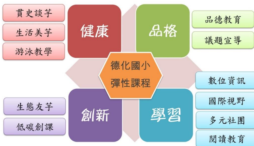
圖一 校本課程發展圖像