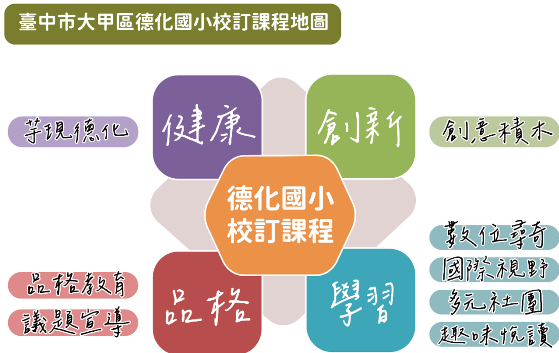
圖一 校本課程發展圖像

本校課程發展委員會依據 12 年國民教育總綱目標、9 項核心素養、學校願景及盤點學校資源後，明確學校課程發展圖像(圖 1)，訂定「健康、品格、創新、學習」等 4 個向度的學校課程願景，課程願景的實踐策略詳見表 1、校訂課程規劃如表 2。